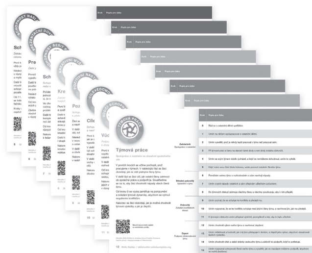
Každá dovednost je rozdělena do konkrétních kroků

Již samotný princip rozdělení jednotlivých dovedností do konkrétních kroků, které v sobě dále skrývají dílčí cíle, jde formativnímu hodnocení naproti: žáci mají díky popisně formulovaným krokům jasnou představu o tom, co se očekává, že aktuálně zvládnou, a zároveň je pro ně uchopitelné, kam v dané dovednosti mohou směřovat dál, až si upevní aktuálně rozvíjený krok.